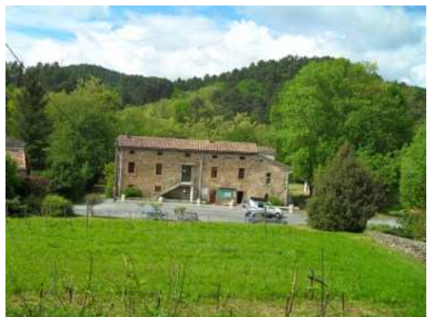
Le Centre d'Hébergement de GAGNIERES